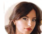
ALBA M a BLANCO

Preludio, Alemanda, Courante, Sarabanda, Gavota I, Gavota II, Giga